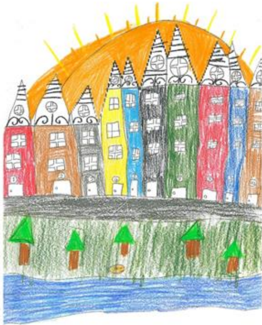
17.10.2015 - 4. sınıf

Düşünme Becerileri öğrencilerimize eleştirel ve çok yönlü düşünme, cesur ve açık fikirli olma, değişime açık olma fırsatları verir.