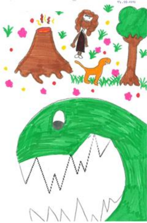
17.10.2015 - 4. sınıf