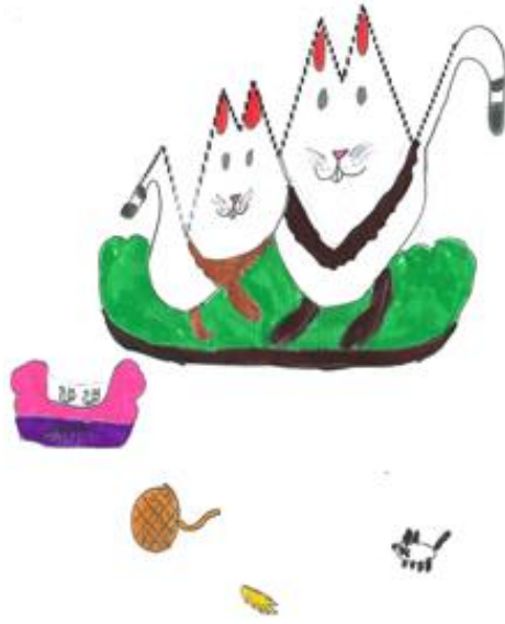
15.10.2015 - 4. sınıf

Düşünme Becerileri öğrencilerimize eleştirel ve çok yönlü düşünme, cesur ve açık fikirli olma, değişime açık olma fırsatları verir.